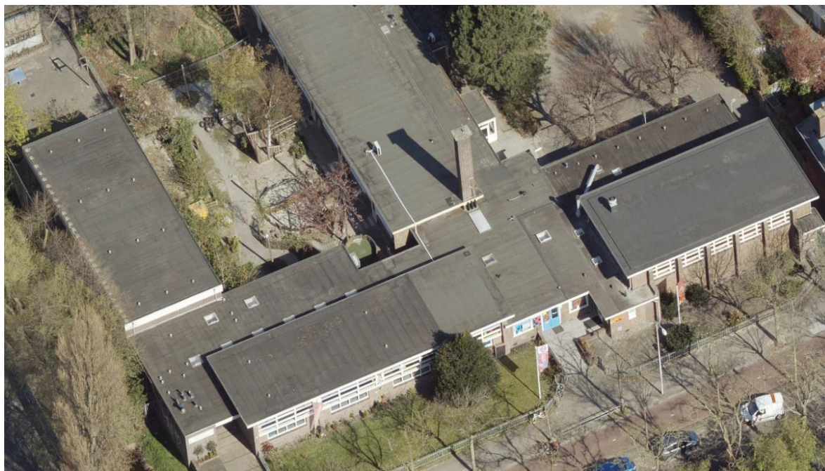
Zonnedak op de Aikido-school aan de Mient 277 in Den Haag

KvK: 76699145 | Fiscaalnummer: 860757602